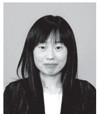
大 関 愛 養 護 教 諭

皆さんには明確な夢や目標がありますか？人間は夢や目標があることよって努力し、達成感を感じながら生活することができると思います。現時点で夢や目標がある人はその夢の実現に向かって努力していきましよう。夢や目標がまだ見つからない人は、まずは身近な目標をたててみてください。そしてその目標を達成したときの喜びや達成できなかったときの悔しさを感じて次こそは達成できるように努力していきましよう。皆さんが学力的にも人間的にも大きく成長していく姿を見るのが楽しみです。