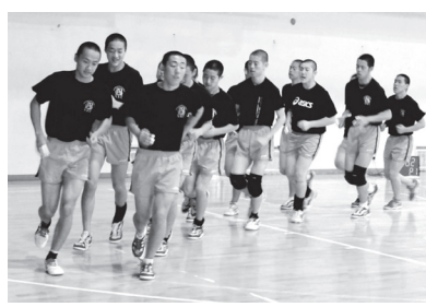
全国大会を目指して