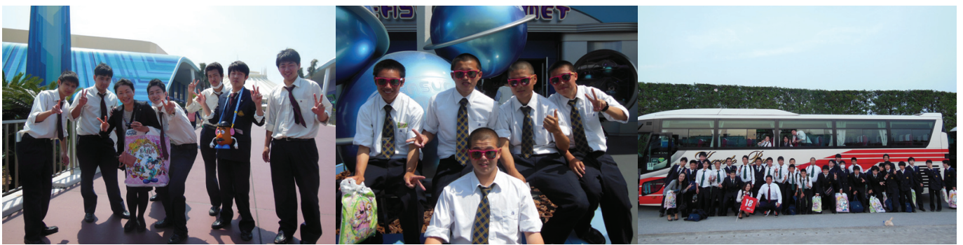
高校／一日バス旅行